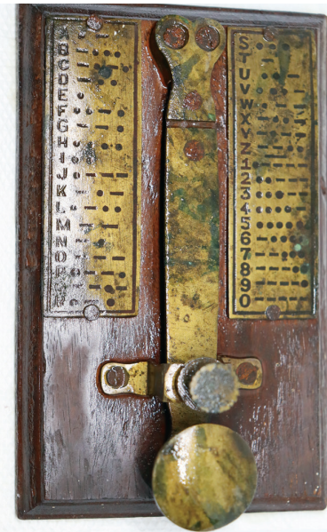
מברק פלוי המשמש לתקשורת במהלך מלחמת העולם השנייה באמצעות הצפנת קוד מורס. שירותי קריפטוגרפיה והודעות.

השיטה, באמצעותה הנאצים העבירו מסרים, הייתה בנויה על המצאתו של המדען היהודי ד"ר עמנואל גולדברג, שהוצגה בכינוס בפריז ב-1925, ואחרי 12 שנות מחקר יצרו לה