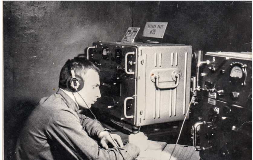
תקשורת קרבת מוצפנת. 1970 סיביר

לדברי גיל דוד, הקסם הרב שבבעולם הסתרת המידע, טמון בדיוק במגוון הזה, המאפשר לכל דבר לשמש כלי להסתרת מסרים חשאיים - בתנאי שהסתרה מתבצעת כהלכה - והכוונה היא באמת לכל אובייקט או פלטפורמה שניתן להעלות על הדעת: מאמצעים פיזיים (מכתבים, כתבות, תשחצים בעיתון, מודעות דרושים, בולים, בגדים, הבעות פנים ותווי מוזיקה) ועד